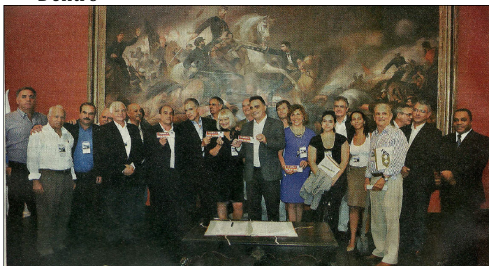
Acima, a AFPF na solenidade de assinatura do ACT da Grão-Pará no Museu Imperial, em Petrópolis (23/03/2012).