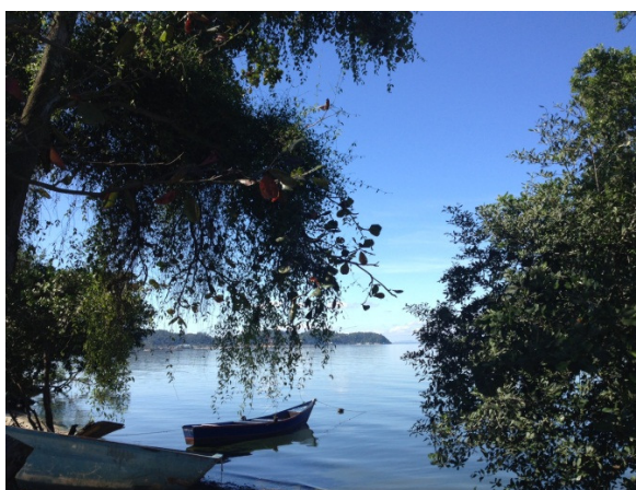
Acima, o Mar, em Guia de Pacobaiba.